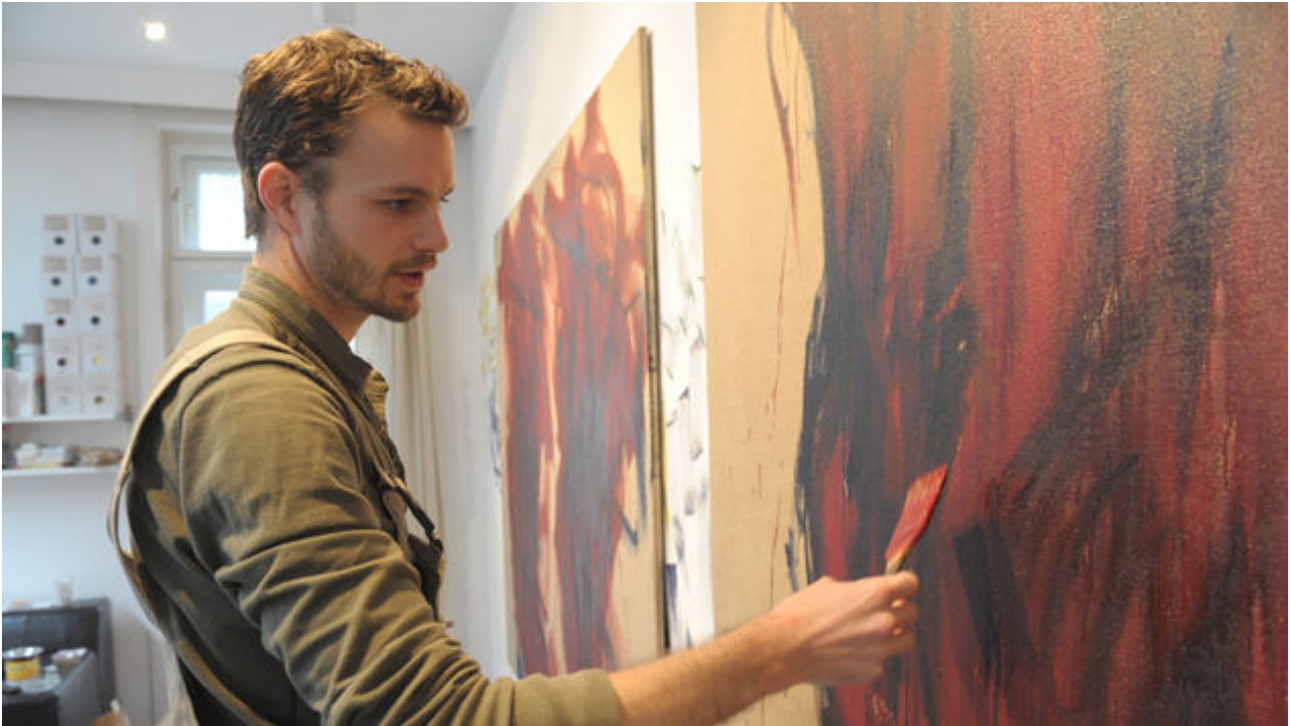
Bild von einem Maler. Als Politikersonn mit Klischees konfrontiert, entspricht das Ex-Model keinem. Der 31-Jährige über späten Mut, älteres Wissen und jüngeren Babyspeck.

Koffein braucht Khol, der keinen Kaffee verträgt, wenn er die Nacht der Kunst wegen zum Tag macht.