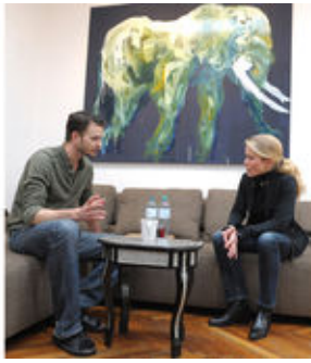
Karger Frühstück im Gespräch.

"So, darf ich etwas anbieten? Grünen oder schwarzen Tee?" - "Kaffee vielleicht?" - "Ich trinke keinen Kaffee, weil ich ihn leider nicht vertrage." Die Wahl des Besuchers fällt auf Coke Zero, weil er Zucker ebenso wenig verträgt wie das Koffein im Kaffee. Koffein braucht er aber, wie ein Blick auf seinen Arbeitstisch zeigt: Ein halbes Dutzend leerer Coke-Zero-Dosen stehen neben einem Küchenmixer, dessen Quirle blau gefärbt sind. Ein Blau, das sich in den zwei Bildern über der Couch wiederfindet, auf der er jetzt Platz nimmt.